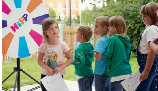
Die HiPPiade: Durch das Glücksrad wird entschieden, welche der vier Spiele-Stationen die kleinen Mitspieler als nächstes absolvieren müssen.

Bei dem international vielfach preisgekrönten Film „Giraffen – Giganten hautnah“ staunten die Kinder darüber, wie diese hochgewachsenen, bis zu eineinhalb Tonnen schweren Kolosse in der afrikanischen Steppe einem Löwenrudel entkommen. Über die langen Zungen, mit denen die Tiere Blätter von den Bäumen rupfen und über die lustigen Verrenkungen, um mit dem langen Hals ans Wasserloch zu gelan-