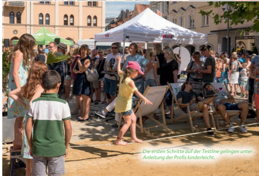
Die ersten Schritte auf der Testline gelingen unter Anleitung der Profis kinderleicht.