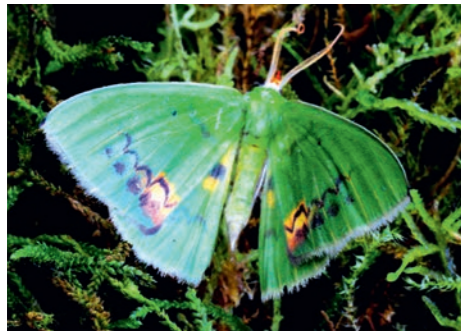
Die neu entdeckte Grünspanner-Art Rho- dochlora claushippi.

Um den Schutz der Arten zu fördern, unterstützt HiPP die Zoologische Staatssammlung München (ZSM) bei der Erforschung von Schmetter- lingen in den Tropen. Dabei wurde in Ecuador ein neuer Artgenosse unter den Grünspannern entdeckt. Zum Dank taufte die Forscher den Schmetterling auf den Namen des Firmenlen-