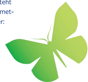
Wissenswertes über Bio-Anbau und Artenvielfalt wird auch digital vermittelt.

Als Symbol für dieses Bekenntnis steht der nach Claus Hipp benannte Schmetterling aus der Art der Grünspanner: „Rhodochlora claushippi“.