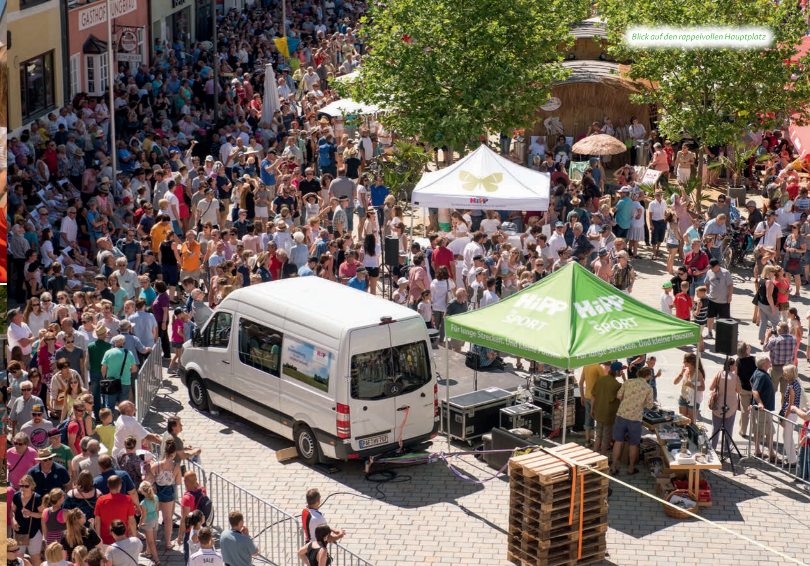
Blick auf den rappelvollen Hauptplatz