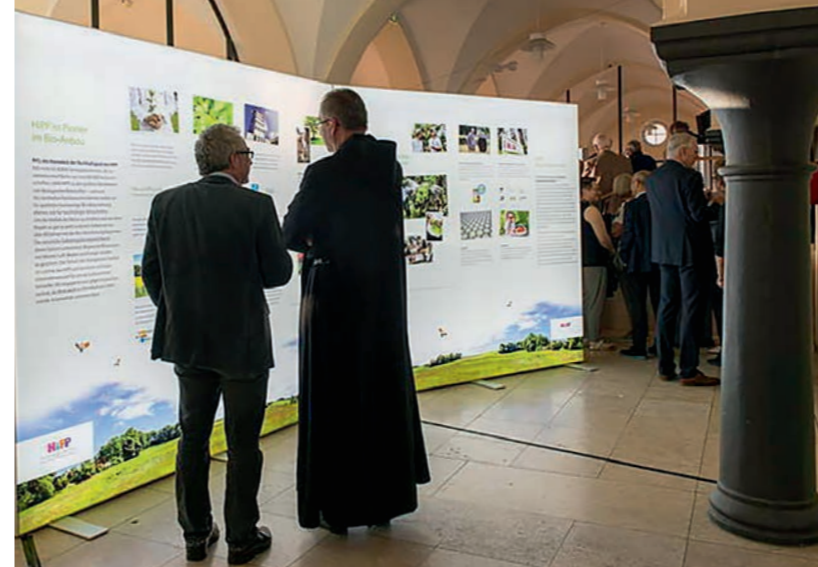
Die Ausstellung bietet viel Gesprächsstoff für jedermann..

Die viel besuchte Ausstellung war von Ende Mai bis Ende Juni im Rathaus Pfaffenhofen zu sehen. Aktuell empfängt sie im Foyer von HiPP noch bis zum Ende des Jahres 2017 die Besucher des Unternehmens mit eindrucksvollen Bildern, die das Engagement von HiPP für Umwelt und Artenvielfalt illustrieren.