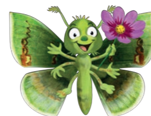
Sascha Schmetterling ist nach dem Vorbild des Rhodochlora claushippi gestaltet.

An diesem Nachmittag lernten die Kinder die kunterbunte Welt der Falter und Raupen näher kennen. Wie wird aus der hässlichen Raupe ein wunderschöner Schmetterling oder mitunter auch nur eine unscheinbare Motte? Warum sind Raupen nützlich, obwohl sie doch manchmal sogar nimmersatt unsere Gartenpflanzen verspeisen? Die kleinen Gäste wurden im Naturkinderhaus auf eine kindgerechte Entdeckungsreise mitgenommen.