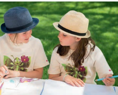
Ob groß oder klein, exotisch oder heimisch – die Schmetterlinge faszinierten die Kinder.

die zu retten versuchen, was noch zu retten ist. Inspiriert von dem, was sie an diesem Nachmittag gesehen und erfahren hatten, malten die Kinder die Schmetterlinge nach und brachten ihren ganz persönlichen Favoriten zu Papier. Die phantasievollen Bilder, die so entstanden sind, schmücken heute die Wände des Naturkinderhauses.