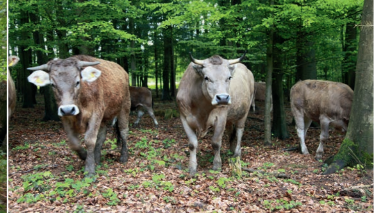
Original Braunvieh weidet auf dem HiPP Musterhof ganzjährig draußen, unter anderem hier im Wald.

Zur Schädlingsbekämpfung wird im Ökoanbau auch auf Vögel und Nutzinsekten gesetzt. Um die Popula-