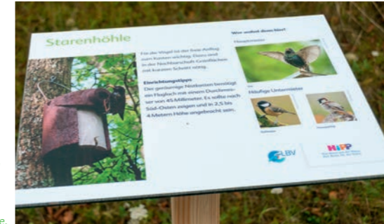
Ein Beispiel für die installierten Infotafeln: Starenhöhle.

Mit Unterstützung der LBV-Kreisgruppe hat HiPP im Sport- und Freizeitpark an der Ilm einen Lehrpfad installiert. Dazu gehören verschiedenste Nistkästen und acht Tafeln, die Informationen über die Behausungen und deren Bewohner geben. Denn jede Art bevorzugt ein ganz spezielles Wohnungsangebot: mit nur einer Öffnung oder mit bis zu drei Löchern; kleiner, größer oder flacher in den Ausmaßen; versteckt oder offen für den freien Anflug. Von nun an können sich die Besucher des Pfads genauer über die jeweilige Behausung, deren Mieter – wie Stare,