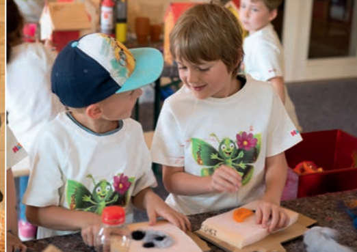
Mithilfe von Nadel und Wolle entstehen bunte Filztierchen.

Aufsicht und Anleitung der Erwachsenen. Auch die niedlichen Ohrenwurmöpfen wurden dank eines bunten Anstrichs im Nu zu einem ansehnlichen Heim für Insekten. Aus einfachen Materialien und mit einigen wenigen Handgriffen wurde außerdem noch schnell ein hübsches Hotel für Wildbienen gezauert, in dem der Nachwuchs samt Futterreserven sicher ist.