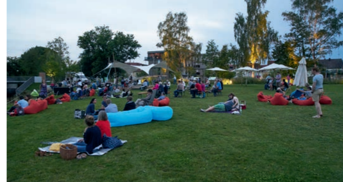
Oben: Die Gäste machen es sich gemütlich und warten gespannt auf den ersten Film.

Der Filmemacher war an diesem Abend persönlich beim HiPP Open-Air-Festival im Pfaffenhofener Bürgerpark anwesend und begrüßte gemeinsam mit