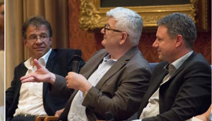
Joschka Fischer wirft einen kritischen Blick auf die Entwicklung der Landwirtschaft.