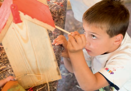
Die Kinder sind mit viel Konzentration bei der Sache.