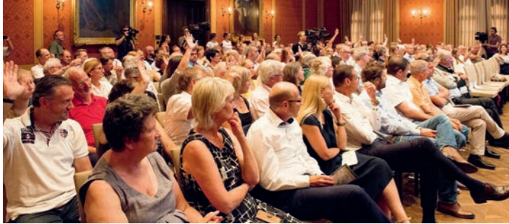
Das Publikum im Festsaal des Pfaffenhofener Rathauses folgt gespannt der Debatte.