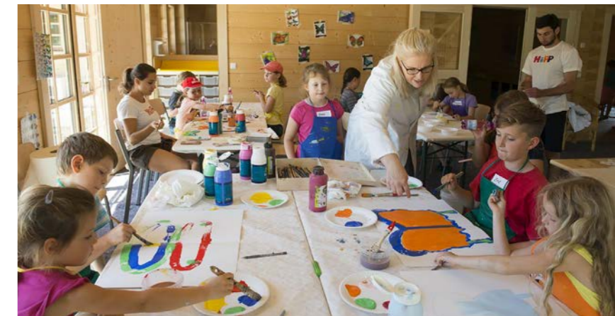
Der Gruppenraum des HiPP Naturkinderhauses wird zur Kinderkunstwerkstatt.