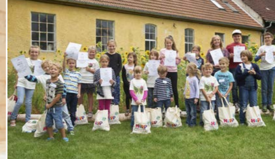
Links: Unter welchem Gläschen versteckt sich bloß der Quetschbeutel-Deckel?

Doch bei HiPP geht niemand mit leeren Händen nach Hause! Deshalb freute sich jedes Kind über eine liebevoll mit HiPP Produkten gefüllte Stofftüte.